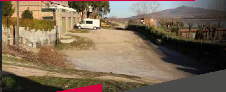
Urbanización de la Cañada desde la piscina hasta la c/ Puerto de Navacerrada, generando una salida segura a la M-608 alternativa a las ya existentes.