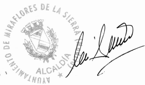
M a Ángeles Rodrigo Alcaldesa Miraflores de la Sierra